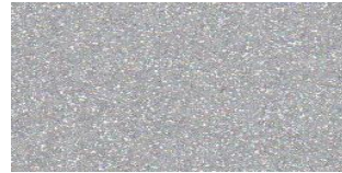
NA-502 EXOTIC SILVER