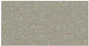
NA-505 MEDIUM BRONZE