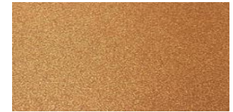
NA-508 COPPER PENNY