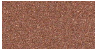
NA-506 DARK CHAMPAGNE