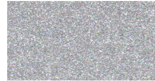
NA-503 BRIGHT SILVER